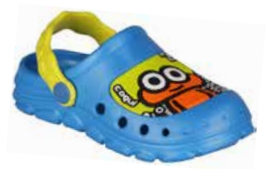
STONEY SEA BLUE/CITRUS