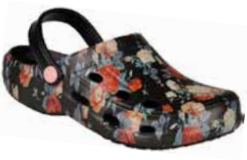
TINA PRINTED BLACK ROSES 1353-205-2200A 1353-205-2200B rozmiary: rozmiary: 37-41 37-41 4-4-4-4-4 2-2-2-2-2