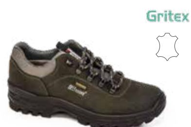
10268D2G rozmiary: 36-47