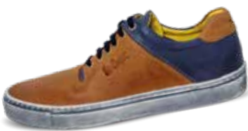
LCWP-19-01-021 rozmiary: 40-45 1-1-2-3-3-2