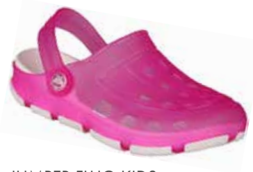
JUMPER FLUO KIDS FUCHSIA/WHITE 6363-100-0532 rozmiary: 26/27-34/35 4-4-4-4-4