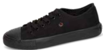
LCW-19-530-054 LCWL-19-530-054 rozmiary: 40-45 rozmiary: 36-41 1-2-3-3-2-1 1-2-3-3-2-1