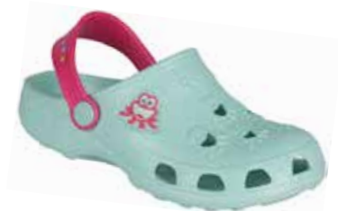
LITTLE FROG MINT/LT FUCHSIA 8701-100-3936A 8701-100-1821B rozmiary: 23/24-31/32 23/24-31/32 4-4-4-4-4 2-2-2-2-2