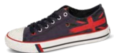
LCW-19-530-033 LCWL-19-530-033 rozmiary: 40-45 rozmiary: 36-41 1-2-3-3-2-1 1-2-3-3-2-1