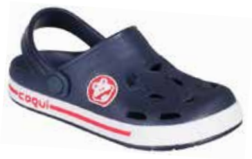
FROGGY NAVY/WHITE 8801-100-2132 rozmiary: 26/27-34/35 4-4-4-4-4