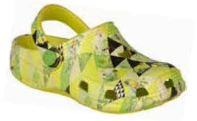
BIG FROG PRINTED CITRUS JUNGLE

rozmiary: 28/29-36/37 4-4-4-4-4 2-2-2-2-2