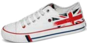
LCW-19-530-031 LCWL-19-530-031 rozmiary: 40-45 rozmiary: 36-41 1-2-3-3-2-1 1-2-3-3-2-1