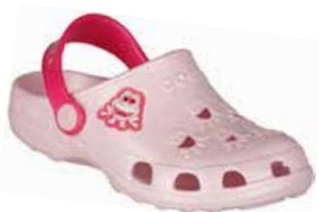
LITTLE FROG PALE PINK/LT FUCHSIA 8701-100-5536A 8701-100-5536B rozmiary: 23/24-31/32 23/24-31/32 4-4-4-4-4 2-2-2-2-2