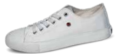
LCWL-19-530-052 rozmiary: 36-41 1-2-3-3-2-1