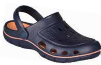
JUMPER NAVY/CORAL 6352-100-2160A 6352-100-2160B rozmiary: rozmiary: 36-42 36-42 2-2-4-4-4-2-2 1-1-2-2-2-1-1