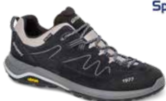
14303A1T rozmiary: 36-46