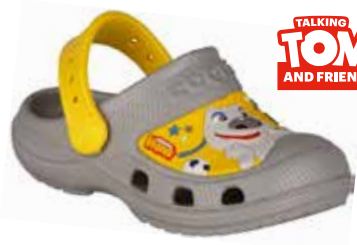
TT MAXI MID GREY/YELLOW 9382-604-4812