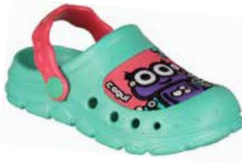
STONEY MINT/NEW ROUGE

rozmiary: 28/29-36/37 4-4-4-4-4 2-2-2-2-2