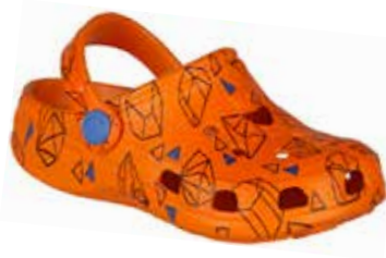
BIG FROG PRINTED DK ORANGE GEOMETRIC

rozmiary: 26/27-34/35 4-4-4-4-4 2-2-2-2-2