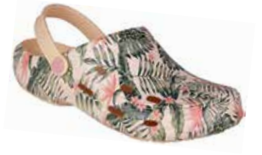
TINA PRINTED BEIGE TROPICAL 1353-204-6100A 1353-204-6100B rozmiary: rozmiary: 37-41 37-41 4-4-4-4-4 2-2-2-2-2