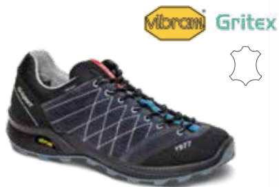
13133V3G rozmiary: 36-46