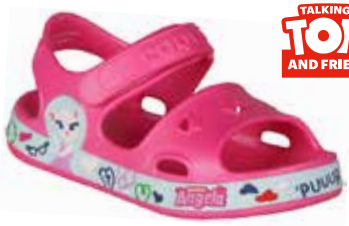
TT FOBEE LT FUCHSIA/LT MINT 8851-602-3644