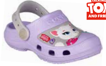
TT MAXI LT LILA/KHAKI GREY 9382-602-0246