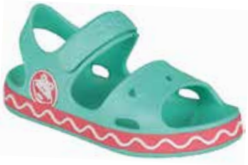
FOBEE MINT/NEW ROUGE 8852-407-3942A 8851-407-3942A

rozmiary: 21/22-28/29 29/30-34/35 4-4-4-4-4 4-4-4-4-4