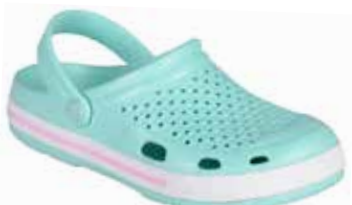
LINDO LT MINT/WHITE 6413-100-4432A 6413-100-4432B rozmiary: 36-42 2-2-4-4-4-2-2