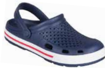
LINDO NAVY/WHITE 6403-100-2132A 6403-100-2132B rozmiary: rozmiary: 41-47 41-47 2-2-4-4-4-2-2 1-1-2-2-2-1-1