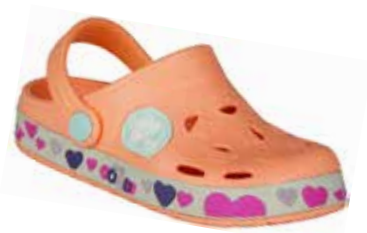
FROGGY CORAL HEARTS 8802-402-6044 rozmiary: 26/27-34/35 4-4-4-4-4