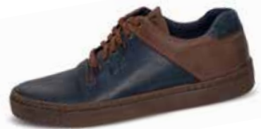
LCWP-19-01-024 rozmiary: 40-45 1-1-2-3-3-2