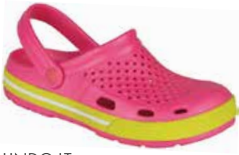
LINDO LT FUCHSIA/CITRUS 6413-100-3613A rozmiary: 36-42 2-2-4-4-4-2-2