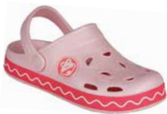
FROGGY CANDY PINK/NEW ROUGE 8801-407-4142 rozmiary: 26/27-34/35 4-4-4-4-4