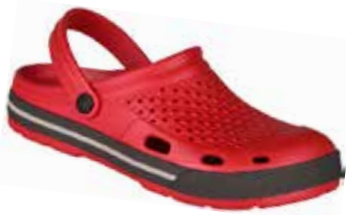
LINDO RED/ANTRACIT 6403-100-0924A 6403-100-0924B rozmiary: rozmiary: 41-47 41-47 2-2-4-4-4-2-2 1-1-2-2-2-1-1