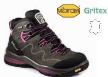
12529D10G rozmiary: 36-43