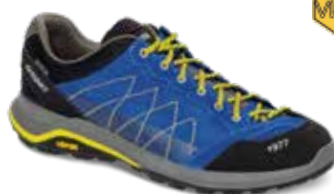
14301V4 rozmiary: 36-46