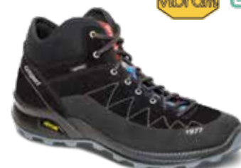
13143V14G rozmiary: 39-47