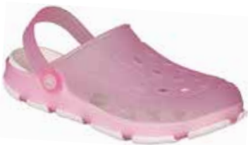
JUMPER FLUO PINK/WHITE 6362-100-3832 rozmiary: 36-41 1-2-3-3-2-1