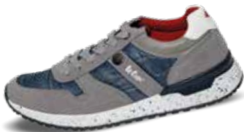
LCW-19-529-051A LCW-19-529-051B rozmiary: 40-45 rozmiary: 41-46 1-2-3-3-2-1 1-2-3-3-2-1