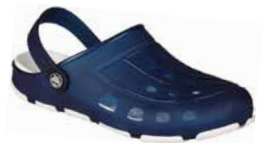
JUMPER FLUO NAVY/WHITE 6362-100-2132 rozmiary: 36-41 1-2-3-3-2-1