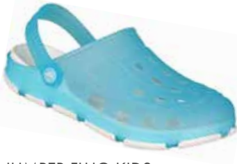
JUMPER FLUO KIDS TURQUOISE/WHITE 6363-100-1932 rozmiary: 26/27-34/35 4-4-4-4-4