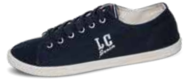
LCW-19-530-082 rozmiary: 40-45 1-2-3-3-2-1