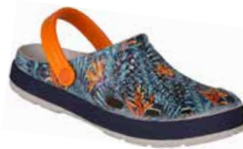
LINDO STONE TROPICAL 6403-202-3021A 6403-202-3021B rozmiary: rozmiary: 41-47 41-47 2-2-4-4-4-2-2 1-1-2-2-2-1-1