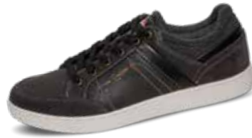
BRIDGE PCHN1206S-0055A rozmiary: 40-45 1-2-3-3-2-1