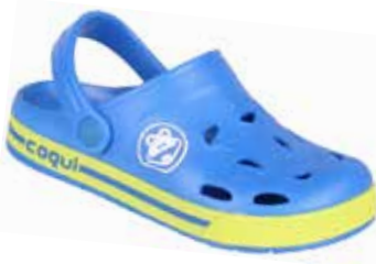
FROGGY ROYAL/CITRUS 8801-100-2013 rozmiary: 26/27-34/35 4-4-4-4-4