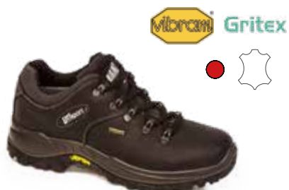
10309D69G rozmiary: 36-47