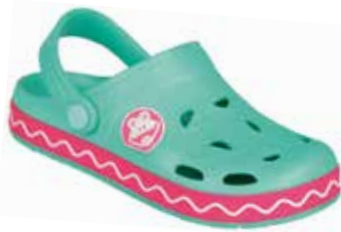
FROGGY MINT/NEW ROUGE 8801-407-3942 rozmiary: 26/27-34/35 4-4-4-4-4