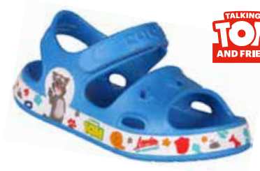
TT FOBEE SEA BLUE/WHITE 8851-601-4732