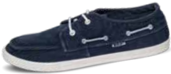
LCW-19-530-091 rozmiary: 40-45 1-2-3-3-2-1