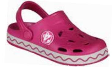
FROGGY MAGENTA/STONE 8801-407-3330 rozmiary: 26/27-34/35 4-4-4-4-4