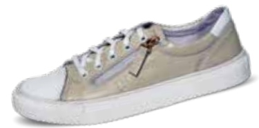
LCWLP-19-01-062 rozmiary: 36-41 1-1-2-3-3-2