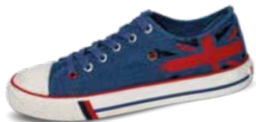
LCW-19-530-032 LCWL-19-530-032 rozmiary: 40-45 rozmiary: 36-41 1-2-3-3-2-1 1-2-3-3-2-1