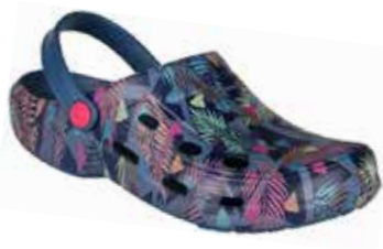
TINA PRINTED NIAGARA BLUE TROPICAL TRIANGLES 1353-206-5100A 1353-206-5100B rozmiary: rozmiary: 37-41 37-41 4-4-4-4-4 2-2-2-2-2