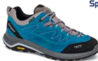
14303A8T rozmiary: 36-46