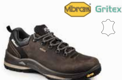
13507D2G rozmiary: 36-47