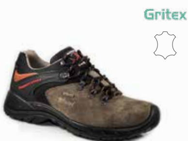
11106S170G rozmiary: 36-47