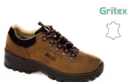
10268D16G rozmiary: 36-47