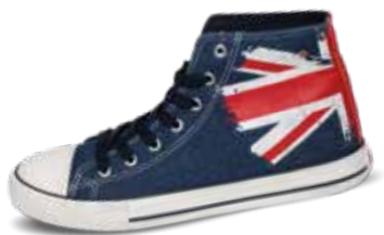
LCW-19-530-041 LCWL-19-530-041 rozmiary: 40-45 rozmiary: 36-41 1-2-3-3-2-1 1-2-3-3-2-1