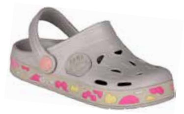
FROGGY KHAKI GREY HEARTS 8802-402-4646 rozmiary: 26/27-34/35 4-4-4-4-4