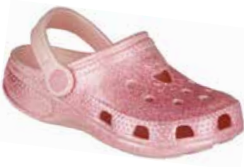
BIG FROG PRINTED CANDY PINK GLITTER

rozmiary: 28/29-36/37 4-4-4-4-4 2-2-2-2-2