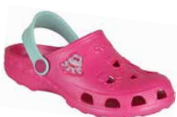
LITTLE FROG LT FUCHSIA/LT MINT 8701-100-3644A 8701-100-3644B rozmiary: 23/24-31/32 23/24-31/32 4-4-4-4-4 2-2-2-2-2