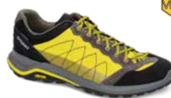
14301V5 rozmiary: 36-46