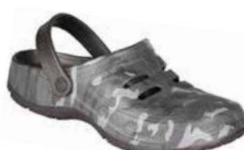
KENSO PRINTED ANTRACIT CAMO 6305-203-2400A 6305-203-2400B rozmiary: rozmiary: 41-46 41-46 2-4-4-4-4-2 1-2-2-2-2-1