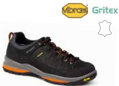
12501N64G rozmiary: 36-47