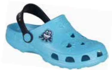
LITTLE FROG BLUE/NAVY 8701-100-1821A 8701-100-1821B rozmiary: 23/24-31/32 23/24-31/32 4-4-4-4-4 2-2-2-2-2