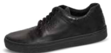
LCWP-19-01-023 rozmiary: 40-45 1-1-2-3-3-2