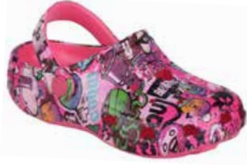
BIG FROG PRINTED NEW ROUGE BIZARRE

rozmiary: 28/29-36/37 4-4-4-4-4 2-2-2-2-2