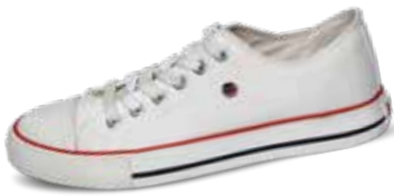
LCW-19-530-011 LCWL-19-530-011 rozmiary: 40-45 rozmiary: 36-41 1-2-3-3-2-1 1-2-3-3-2-1

Zastosowana wkładka wykonana jest ze specjalnej pianki, która idealnie dopasowuje się do profilu stopy zapamiętując jej kształt.