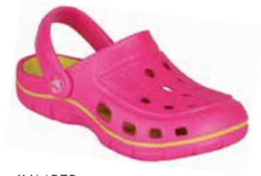
JUMPER 6353 LT FUCHSIA-CITRUS rozmiary: 26/27-36/37 4-4-4-4-4