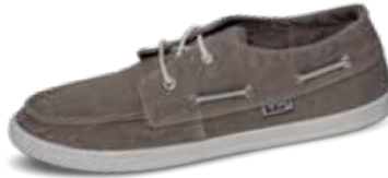
LCW-19-530-092 rozmiary: 40-45 1-2-3-3-2-1