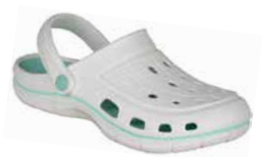
JUMPER WHITE/LT MINT 6352-100-3244A 6352-100-3244B rozmiary: rozmiary: 36-42 36-42 2-2-4-4-4-2-2 1-1-2-2-2-1-1