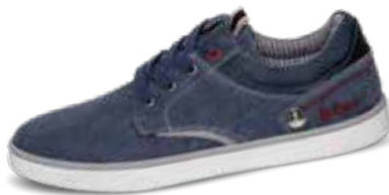
LCW-19-529-072A LCW-19-529-072B rozmiary: 40-45 rozmiary: 41-46 1-2-3-3-2-1 1-2-3-3-2-1