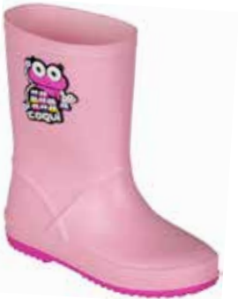
RAINY PINK/FUCHSIA 8505-100-4105 rozmiary: 24-29 2-2-2-2-2-2