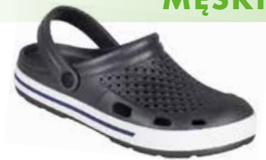
LINDO ANTRACIT/WHITE 6403-100-2432A 6403-100-2432B rozmiary: rozmiary: 41-47 41-47 2-2-4-4-4-2-2 1-1-2-2-2-1-1