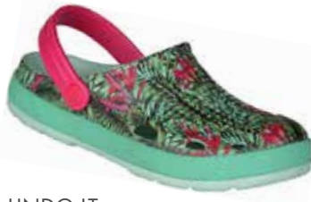
LINDO LT MINT TROPICAL 6413-201-4439A 6413-201-4439B rozmiary: rozmiary: 36-42 36-42 2-2-4-4-4-2-2 1-1-2-2-2-1-1