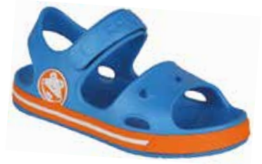
FOBEE SEA BLUE/DK ORANGE 8851-100-4710A 8852-100-4710A

rozmiary: 21/22-28/29 29/30-34/35 4-4-4-4-4 4-4-4-4-4