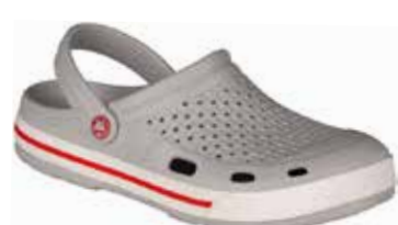
LINDO KHAKI GREY/WHITE 6413-100-4632A 6413-100-4632B rozmiary: 36-42 2-2-4-4-4-2-2