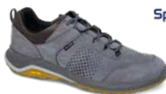
14313C2T rozmiary: 40-46