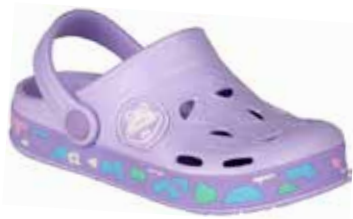
FROGGY LT LILA HEARTS 8802-402-0202 rozmiary: 26/27-34/35 4-4-4-4-4