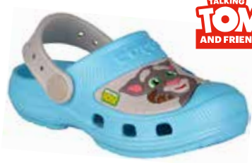
TT MAXI NEW BLUE/STONE 9382-601-1830

rozmiary: 29/30-34/35 21/22-28/29 4-4-4-4-4 4-4-4-4-4