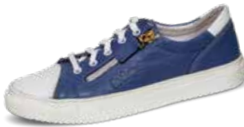
LCWLP-19-01-061 rozmiary: 36-41 1-1-2-3-3-2