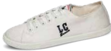
LCW-19-530-081 rozmiary: 40-45 1-2-3-3-2-1