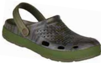
LINDO ARMY GREEN 6403-100-2632A 6403-100-2632B rozmiary: rozmiary: 41-47 41-47 2-2-4-4-4-2-2 1-1-2-2-2-1-1