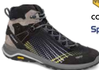
14309A4T rozmiary: 36-46