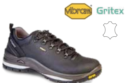
13507D6G rozmiary: 36-47