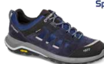
14305A3T rozmiary: 36-46