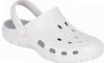
JUMPER WHITE/KHAKI GREY 6351-100-3246A 6351-100-3246B rozmiary: rozmiary: 41-47 41-47 2-2-4-4-4-2-2 1-1-2-2-2-1-1