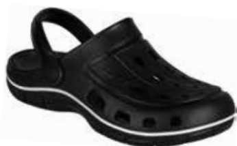
JUMPER BLACK/ANTRACIT 6351-100-2224A 6351-100-2224B rozmiary: rozmiary: 41-47 41-47 2-2-4-4-4-2-2 1-1-2-2-2-1-1