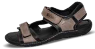
LCWP-19-532-041 rozmiary: 40-45 1-2-3-3-2-1