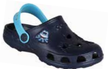
LITTLE FROG NAVY/BLUE 8701-100-2118A 8701-100-2118B rozmiary: 23/24-31/32 23/24-31/32 4-4-4-4-4 2-2-2-2-2