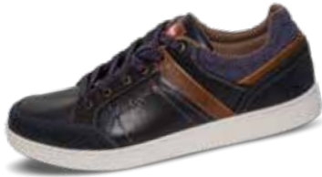
BRIDGE PCHN1206S-0040A rozmiary: 40-45 1-2-3-3-2-1