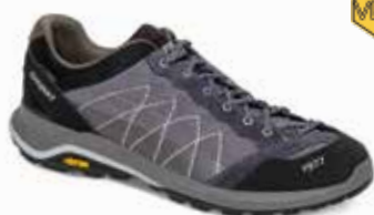
14301V3 rozmiary: 36-46