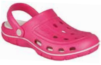
JUMPER LT FUCHSIA/WHITE 6352-100-3632A rozmiary: 36-42 2-2-4-4-4-2-2