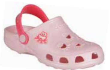
LITTLE FROG CANDY PINK/NEW ROUGE 8701-100-4142A 8701-100-4142B rozmiary: 23/24-31/32 23/24-31/32 4-4-4-4-4 2-2-2-2-2