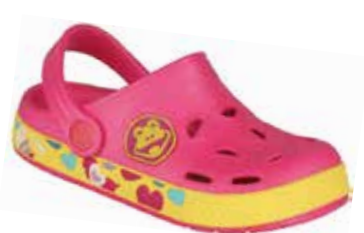
FROGGY 8802 LT FUCHSIA-YELLOW rozmiary: 26/27-34/35 4-4-4-4-4