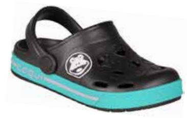
FROGGY ANTRACIT/TURQUOISE 8801-100-2419 rozmiary: 26/27-34/35 4-4-4-4-4