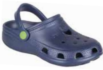
BIG FROG NAVY