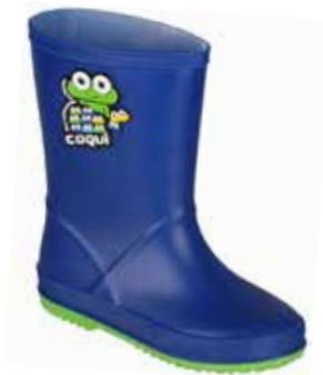
RAINY BLUE/LIME 8505-100-5014 rozmiary: 24-29 2-2-2-2-2-2