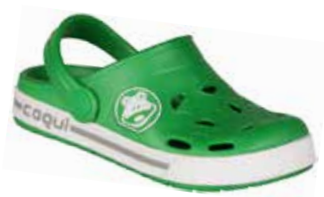
FROGGY NEW GREEN/WHITE 8801-100-5732 rozmiary: 26/27-34/35 4-4-4-4-4