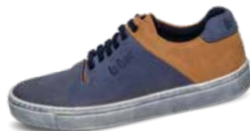
LCWP-19-01-022 rozmiary: 40-45 1-1-2-3-3-2