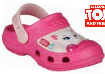
TT MAXI LT FUCHSIA/CANDY PINK 9382-602-3641