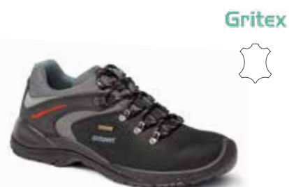
11106N191G rozmiary: 36-47