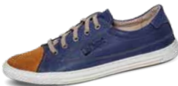
LCWLP-19-01-071 rozmiary: 36-41 1-1-2-3-3-2