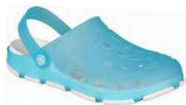
JUMPER FLUO TURQUOISE/WHITE 6362-100-1932 rozmiary: 36-41 1-2-3-3-2-1