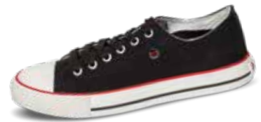
LCW-19-530-013 LCWL-19-530-013 rozmiary: 40-45 rozmiary: 36-41 1-2-3-3-2-1 1-2-3-3-2-1