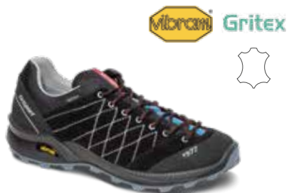
13133V31G rozmiary: 36-46