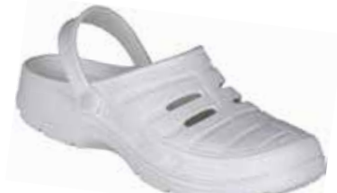
KENSO WHITE 6303-100-3200A 6303-100-3200B rozmiary: rozmiary: 41-46 41-46 2-4-4-4-4-2 1-2-2-2-2-1