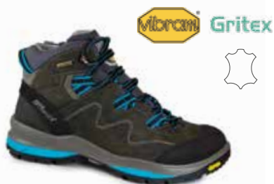
12529D69G rozmiary: 36-43