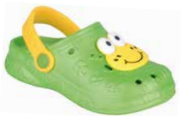
HOPPA LIME 9381-100-1400 rozmiary: 21/22-28/29 4-4-4-4-4