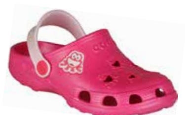
LITTLE FROG LT FUCHSIA/PALE PINK 8701-100-3655A 8701-100-3655B rozmiary: 23/24-31/32 23/24-31/32 4-4-4-4-4 2-2-2-2-2