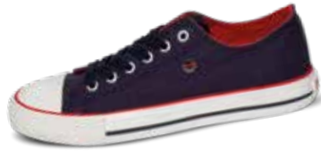
LCW-19-530-012 LCWL-19-530-012 rozmiary: 40-45 rozmiary: 36-41 1-2-3-3-2-1 1-2-3-3-2-1