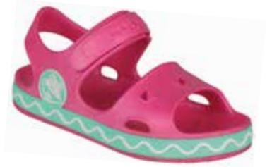
FOBEE LT FUCHSIA/MINT