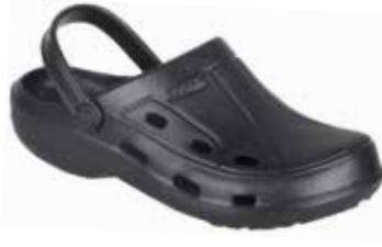
TINA BLACK 1353-100-2200A 1353-100-2200B rozmiary: rozmiary: 37-41 37-41 4-4-4-4-4 2-2-2-2-2