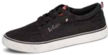
LCW-19-530-062 rozmiary: 40-45 1-2-3-3-2-1