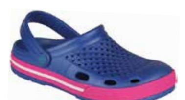
LINDO NEW ROYAL/FUCHSIA 6413-100-5005A 6413-100-5005B rozmiary: 36-42 2-2-4-4-4-2-2