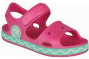
FOBEE LT FUCHSIA/MINT 8852-407-3639A