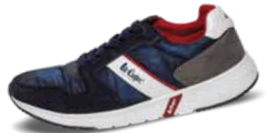
LCW-19-529-032A LCW-19-529-032B rozmiary: 40-45 rozmiary: 41-46 1-2-3-3-2-1 1-2-3-3-2-1