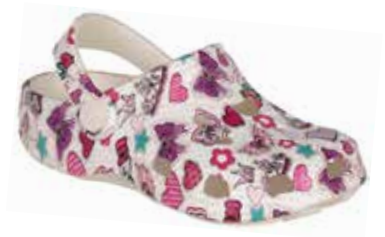
BIG FROG PRINTED PEARL HEARTS

rozmiary: 28/29-36/37 4-4-4-4-4 2-2-2-2-2