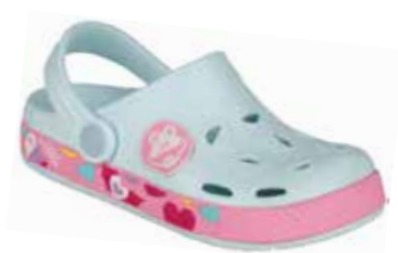
FROGGY PASTEL BLUE/DK PINK 8802-402-5206 rozmiary: 26/27-34/35 4-4-4-4-4