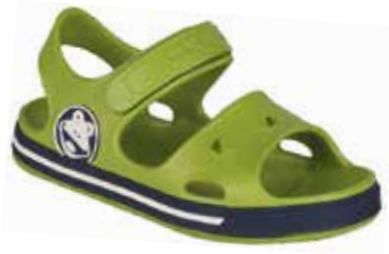
FOBEE GREEN/NAVY 8851-100-1521A