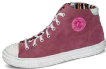
LCWLP-19-01-053 rozmiary: 36-41 1-1-2-3-3-2