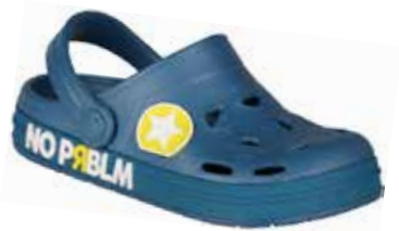
FROGGY NIAGARA BLUE PRBLM 8802-404-5151 rozmiary: 26/27-34/35 4-4-4-4-4