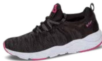
LCWL-19-529-081 rozmiary: 36-41 1-2-3-3-2-1