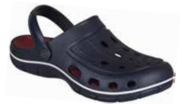
JUMPER NAVY/DK RED 6351-100-2135A 6351-100-2135B rozmiary: rozmiary: 41-47 41-47 2-2-4-4-4-2-2 1-1-2-2-2-1-1