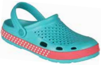
LINDO TURQUOISE/NEW ROUGE 6415-406-1942A 6415-406-1942B rozmiary: rozmiary: 36-42 36-42 2-2-4-4-4-2-2 1-1-2-2-2-1-1