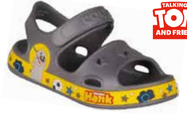
TT FOBEE DK GREY/YELLOW 8851-604-2512