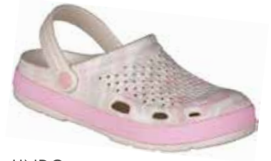
LINDO PEARL CAMO 6413-203-3155A 6413-203-3155B rozmiary: rozmiary: 36-42 36-42 2-2-4-4-4-2-2 1-1-2-2-2-1-1