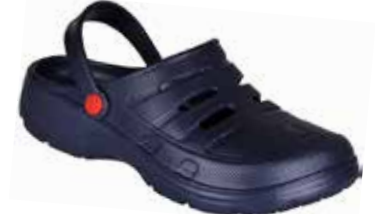
KENSO NAVY 6305-100-2100A 6305-100-2100B rozmiary: rozmiary: 41-46 41-46 2-4-4-4-4-2 1-2-2-2-2-1