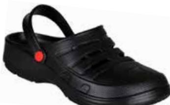
KENSO BLACK 6305-100-2200A 6305-100-2200B rozmiary: rozmiary: 41-46 41-46 2-4-4-4-4-2 1-2-2-2-2-1