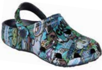
BIG FROG PRINTED NAVY BIZARRE

rozmiary: 28/29-36/37 4-4-4-4-4 2-2-2-2-2