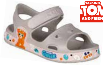
TT FOBEE STONE/PINK 8851-603-3004